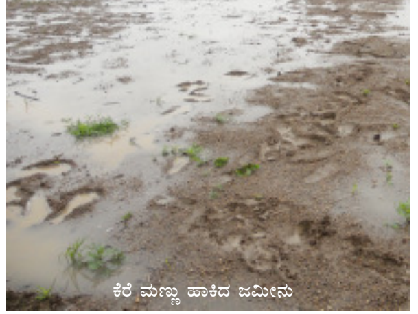
ಕೆರೆ ಮಣ್ಣು ಹಾಕಿದ ಜಮೀನು

ಮಣ್ಣು ಫಲವತ್ತತೆ ಇರುವವರೆಗೂ ಕಾಮಧೇನು-ಕಲ್ಪವೃಕ್ಷವಿದ್ದಂತೆ. ಕಾರಣಾಂತರಗಳಿಂದ ಫಲವತ್ತತೆ ಕಡಿಮೆಯಾದಾಗ ಏನು ಮಾಡಬೇಕು. ಮರುಷೂರಣ ಮಾಡುವುದು ಸಲಿಯಾದ ಕ್ರಮ. ಕೆರೆಯ ಮಣ್ಣನ್ನು ಸೇರಿಸುವುದು ಒಂದು ಕ್ರಮವೇನೋ ನಿಜ. ಆದರೆ, ಕೆಲ ದಿನಗಳ ನಂತರ .....? ಲೇಖಕರು ಜಿಂತನೆಗೆ ಹೆಚ್ಚುವ ಶ್ರಮವನ್ನು ಮುಂದಿರಿಸಿದ್ದಾರೆ. ಅನುಭವಿಗಳೂ ತಮ್ಮ ಅನಿಸಿಕೆ ತಿಳಿಸಬಹುದು.